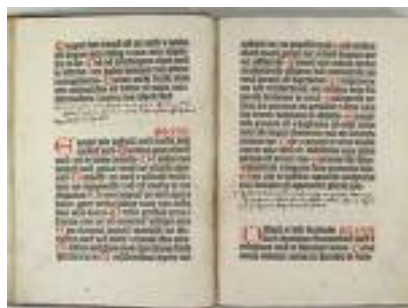
Uppslag hämtat ur " Psalterium Upsalense "

Boktryckarkonsten kom till Sverige år 1483 med boktryckaren Johan Snell. Han kom till Stockholm via Danmark från Lübeck. Ett av hans allra första arbeten var att trycka en mässbok, " Missale Upsalense ", åt Uppsala ärkestift. Men det var inte hans första bok. Den första bar titeln " Dialogus creaturarum optime moralizatus " och trycktes 1483 och var, skulle man kunna säga, en slags fabelsamling.