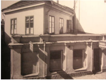
Tryckerihuset på S:t Perskyrkans grund