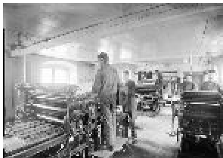
Tryckerihall vid Edvard Berlings Akademiboktryckeri på Västra Ågatan 24

Akademiboktryckeriet levde vidare - nu i fri konkurrens och utan privilegium. Det var en situation som företaget inte fullt ut behärskade. Täta ägarbyten och hårdnande konkurrens förbättrade knappast situationen.