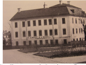
Hit till nuvarande Juridicum flyttade Esaias Edquist tryckeriet