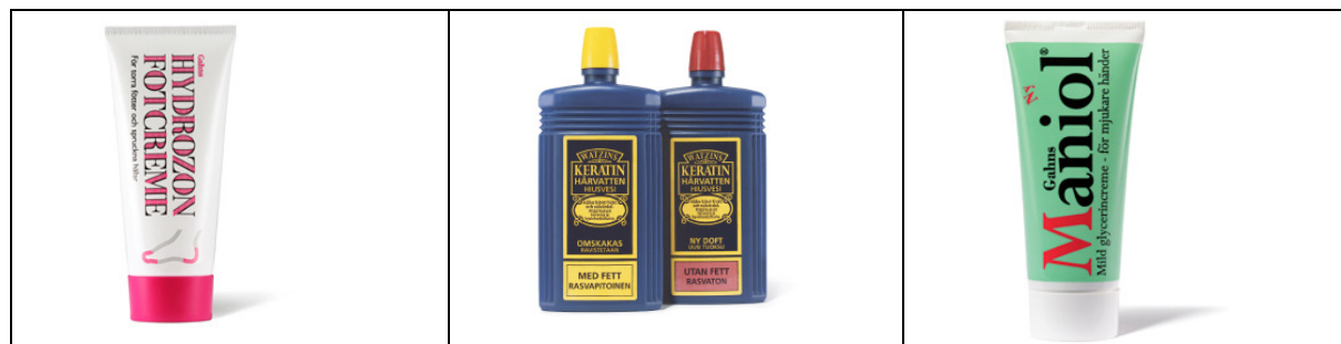
Storsäljande produkter från Gahns

Försäljningsframgångarna med främst Aseptinet och Amykosen ledde till att man på Gahns ganska snart började fundera över om dessa produkter även kunde säljas utanför Sveriges gränser. Något stort segertåg på världsmarknaden blev det väl inte men i de nordiska länderna gick försäljningen bra. Produkterna såldes hyfsat även i Tyskland och Frankrike. Enstaka order från Sydamerika, USA, Medelhavsländerna, Kina och Japan registrerades också. I allt väsentligt var Gahns det enda industriföretaget i Uppsala som hade en exportmarknad.