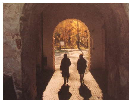
Uppsala slott, Kung Jans port, som renoverades av Sh-Bygg