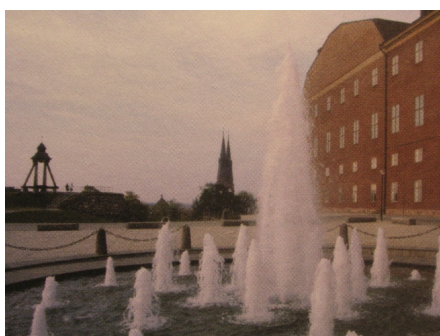
Uppsala slott, borggården efter ombyggnaden 1972

Under årens lopp har Sh-Bygg utfört många uppdrag på och vid Uppsala slott. Ett av de mer omfattande projekten var ombyggnaden av borggården 1972.