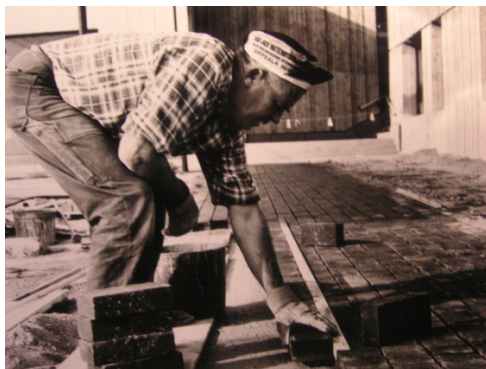
Stensättarens arbetsställning är "inte sällan obekvämt"