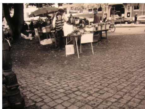
..... detsamma kan sägas om Fyris torg