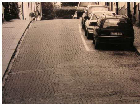
Öfvre Slottsgatan är ett ovanligt vackert stenläggningsarbete utfört av Sh-Bygg ...

Fruängen, Högdalen, Rågsved, Hagsätra, Vällingby m.fl. Stenläggningen av Vällingby var på sin tid Sveriges till omfånget största stensätterientreprenad.