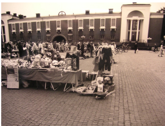
Vaksala torg är ett bland många torg i Uppsala som stenlagts av Sh-Bygg