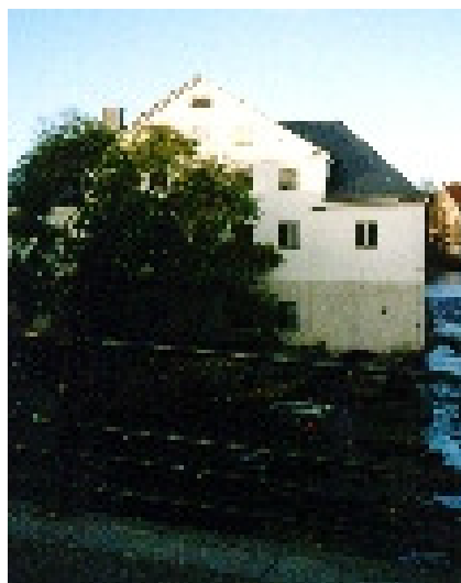
Det nuvarande kvarnhuset från 1760-talet är ombyggt till lokaler för Upplandsmuseet