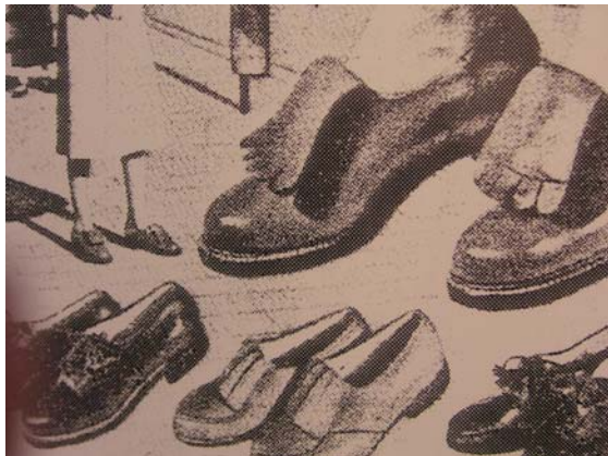
Skomode från början av 1940-talet

År 1905 anskaffades en ny och större uppsättning maskiner som gjorde det möjligt att tillverka skor såväl snabbare som i större omfattning. Det industriella inslaget i skoproduktionen var nu betydande. Detta år betecknades också som en höjdpunkt i företagets dittillsvarande utveckling då företaget tillverkade 61 107 par skor med ett sammanlagt produktionsvärde av 370 070 kronor.