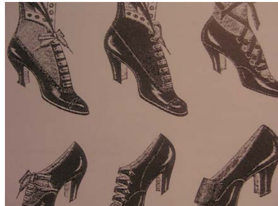
Från slutet på 1800-talet till cirka 1920 var det knäppskor som gällde

Nästa stora steg i skoföretagets utveckling kom 1914. Med den ökade omfattning som firman fått ansågs det lämpligt att ombilda företaget till aktiebolag. Förberedelserna för aktiebolagsbildningen gjordes under 1913 och den 11 februari 1914 inregistrerades AB L E Larsson & Co.