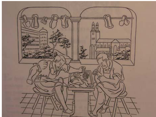
Tecknad bild från ett skomakeri