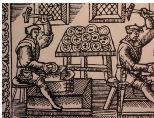
I Sverige har det slagits mynt sedan 900-talet. Bilden ovan här hämtad från ett träsnitt ur Olaus Magnus Historia om de nordiska folken från 1500-talet

I dag då vi lärt oss att betrakta bankväsendet som en ofrånkomlig förutsättning för att samhällslivet ska fungera är det inte långt till frågan hur ett land alls kunde existera utan ett ordnat bankväsende. Behovet av banker kom först med industrialiseringen. Det industrialiserade samhället förutsatte ett system med pengar, prissättning och krediter där tillgång och efterfrågan bestämde varans pris. På självhushålllets dagar behövdes ingenting sådant och därför fanns det inte heller.