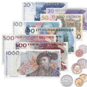
I dag ser våra svenska pengar ut så här

Den stora myntreformen kom 1873 och Sverige övergick då till guldmyntfot. Till en början - den 1 april - bestämdes att Sverige och Danmark skulle börja handla i kronor och ören medan unionsbrodern Norge var försiktigare och ställde sig utanför. För Sveriges del innebar beslutet att vi övergav riksdalern och marken som myntenheter.