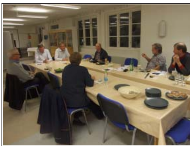
En gång per år brukar det bli surströmmingskväll. Det blev det inte den här gången.