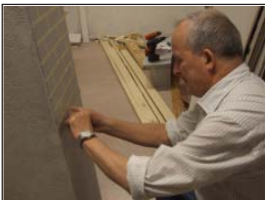
...största tema ' Mjolk och människor '. Fiberskivor har ersatt wellpapp och en rad tidigare lagrade 2,4 m breda bilder har monterats på träunderlag. Just nu slutförs bildurvalet. De tidigare mejerianställda inbjuds till visning 27/10.