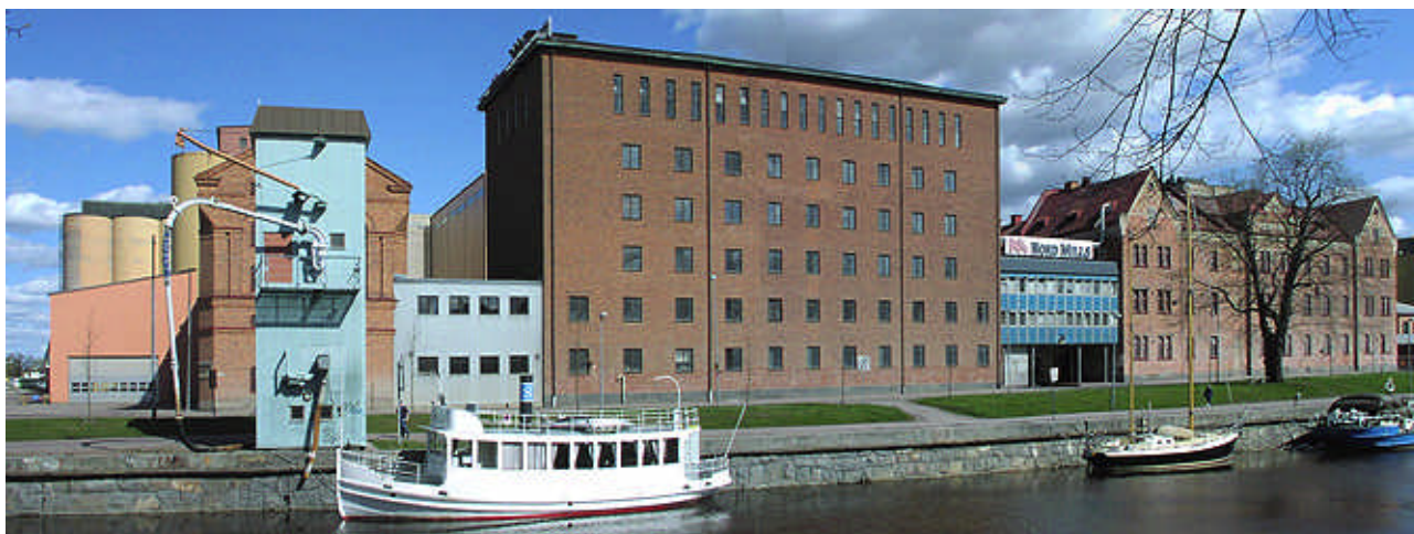
Från väster. Till vänster Silo 3 (11) bakom mottagningen (9). Skeppselevatoren (2) skymmer Silo 1 (1), bakom den ans Silo 2 (8). Silo 1 har en förbindelse (3) till stora kvarnbyggnaden (4), som förbinds av kontoret (5) med jästfabriken (6).