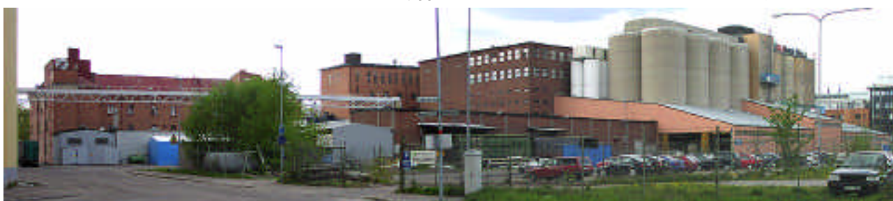
Från öster. I vänstra kanten en av Lantmännens silor, med en elevator till Ångvarnsområdet. Bakom elevatoren ses jästfabriken (6), framför den några låga förråd etc (16). Nästa höga fasad är kvarnbyggnaden (4). Till höger om den mjölsilon (utan fönster, 7B) sammanbyggd med maccaronifabriken (7A). Därefter en liten silo i vitt (13). Framför dem det låga magasinet (15). Bredvid detta in/utlastningshallen (14), därbakom den gråa Silo 4 (12) samt Silo 3 (11) under målning.