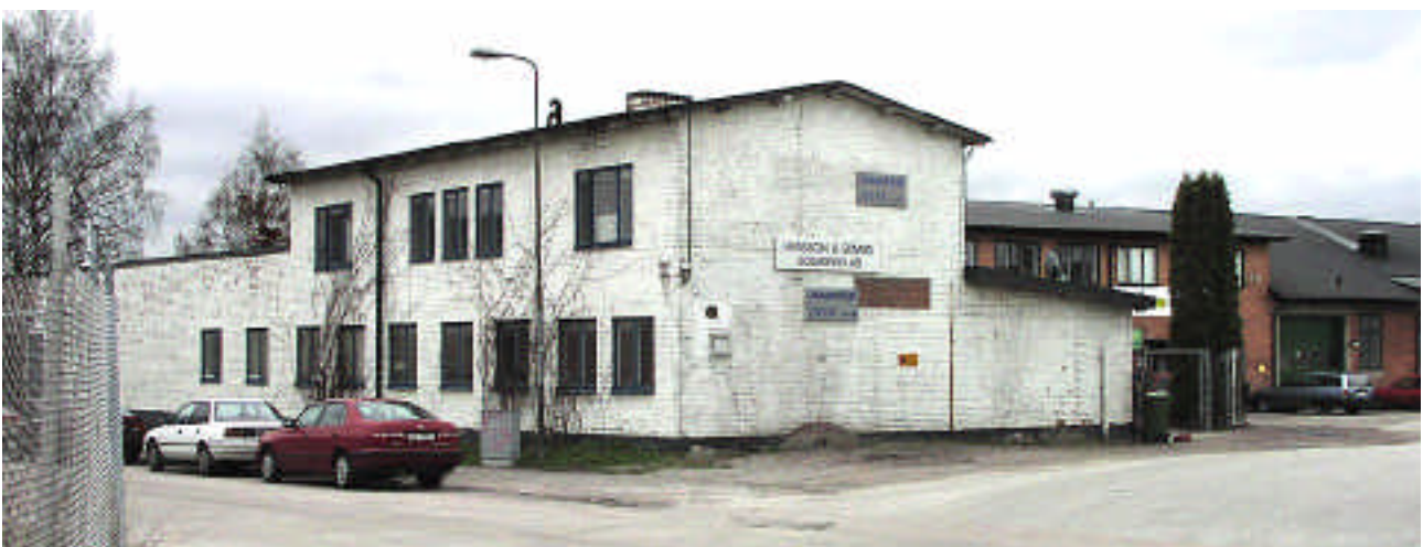
Från nordost. Hus 2 har styckats av till en egen fastighet, och tegelfasaden är vitmålad. Till höger skimtar hus 1.