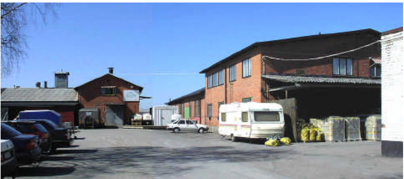
Från sydost. Till vänster hus 4 och gaveln på hus 3. Till höger f d slakteriet 1, där östra änden byggdes om till två våningar 1942, för bl a personalrum. Längst till höger hörnet på hus 2.