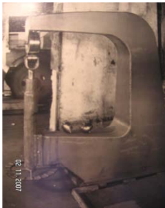
Maskinen på bilden ovan är en PEBA plåtdrivningsmaskin, som Pettersson & Barr tillverkade cirka 100-talet av.