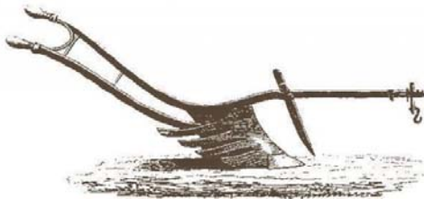
Jordbruksredskap av skilda slag tillverkades på Kvarnsmedjan