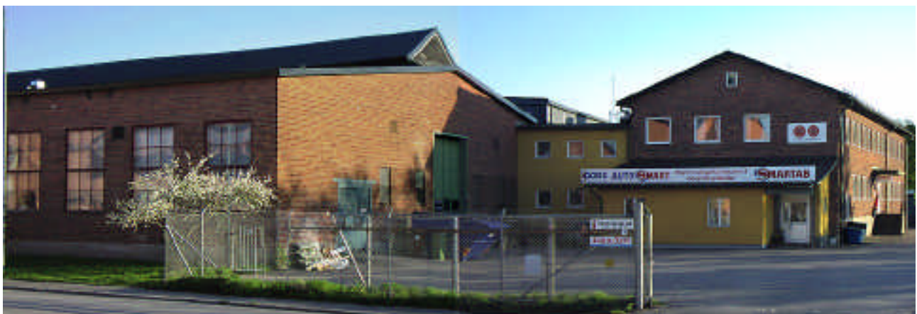
Från nordost. Till höger kontoret 1 med tillbyggnaden 1B, till vänster verkstaden 2.

Kontoret och verkstan 2 har en tidstypisk arkitektur som förenar traditionell form – sadeltak och regelbunden fönsterplacering – med funktionalism: ospröjsade eller storrutiga fönster och avsaknad av dekor. Det finns dock detaljer på kontoret: entrén har räcke i tidstypiskt smide och ett skärmtak täckt med kopparplåt. Det gamla förrådet är en övergiven kvarleva av de första husen på tomten, och har en låg skärmgavel. Det nya kontoret är i 70-talsfunkis, en låg låda präglad av byggelementens format.