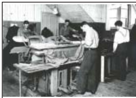
Foto från pressningsavdelningen på Kappfabriken. Från Märta Andersson.