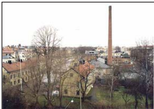
Mejerikvarteret sett uppifrån Siviahuset tvärsöver Vaksalagatan före byggnationen som gjordes då detaljplanen för kvarteret fastställdes. Foto av Anders Damberg 1999.