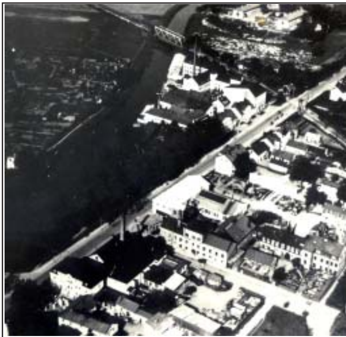
Foto taget någon gång före eller efter år 1930 över en del av Svartbäckens dåvarande industriområde. Just i Fabriksgatans västra ände syns det som varit brännerifastighet en gång. Skorstenen var ännu kvar. Ovanför där Fabriksgatan gick, där går idag Luthagsleden. Förstoring ur foto taget av okänd fotograf, från Uppsala Universitetsbiblioteks samlingar.