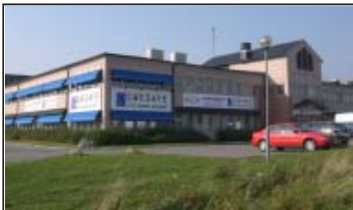
Vid korsningen mellan Vattholmavägen och Gamla Uppsalagatan finns idag företaget Swesafe. Det är dock mer känt under sitt tidigare namn Pettersson & Barr.

1) På Holmen i Fyrisån ligger idag Upplandsmuseet. Kvarnsmedjan var beläget i ett av de gårdshus som än idag finns kvar.