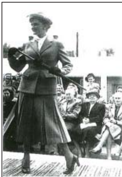
Två foton från modeuppvisningar. De brukade ske inne på gården utanför fabriken med personalen som åskådare.