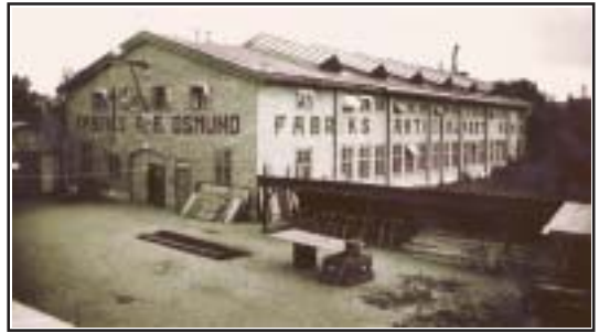
Fastigheten vid Adilsgatan i Svartbäcken kom sedan företaget flyttat till Sägargatan att nyttjas av Nordiska Bandväveriet AB. Den revs 1976 sedan textilfabriken upphört.