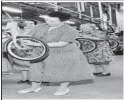
Emballering av Bambinocyklar på Nymans Verkstäder.

dominikanermunkarna, kända för sin vilja och förmåga att bygga med tegel, som gick i spetsen. Den äldsta kända tegelugnen, den under Biskopsgatan, kan även den härledas till 1280-talet. Allt sedan dess och fram till 1970-talet har det tillverkats tegel, keramik och kakel i Uppsala med omnejd, med Uppsala Ekeby AB och S:t Eriks AB som de stora giganterna. Härutöver har funnits ytterligare dryga dussinet tegel- och kakelfabriker i en ring runt staden. Stadsdelar som Fålhagen, Petterslund, Svartbäcken, Tuna Backar m fl är mer eller mindre byggda på gamla tegelbruksområden.